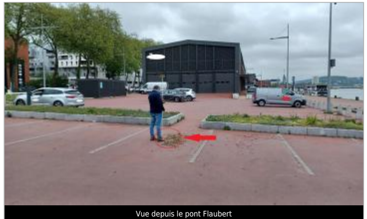
Vue depuis le pont Flaubert

Coordonnées WGS84 : X: 1.06483213 / Y: 49.44465800