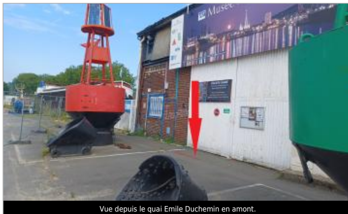
Vue depuis le quai Emile Duchemin en amont.