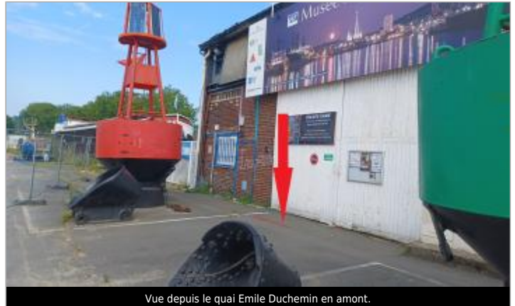
Vue depuis le quai Emile Duchemin en amont.

Coordonnées WGS84 : X: 1.05977739 / Y: 49.44449150