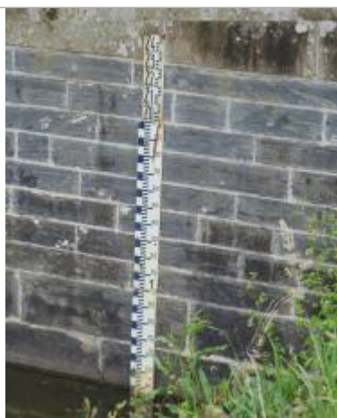
Echelle limnimétrique n°1 à l'aval de l'écluse de Mons à Bruz

Altitude calculée de l'eau (en m) : 18.659 m