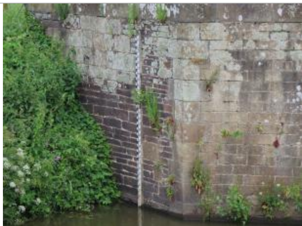
Echelle limnimétrique à l'aval de l'écluse de Cicé à Bruz

Altitude calculée de l'eau (en m) : 20.142 m