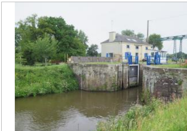
Vue générale de l'aval de l'écluse de Cicé à Bruz

Coordonnées WGS84 : X: -1.76689160 / Y: 48.05081320