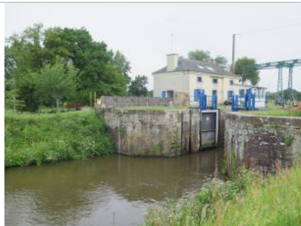
Vue générale de l'aval de l'écluse de Cicé à Bruz