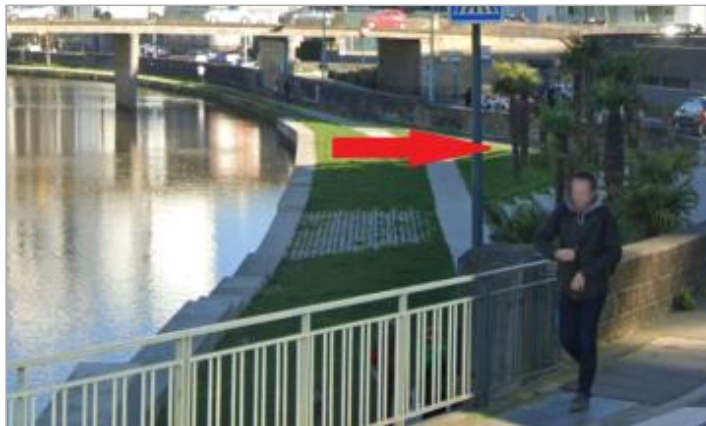
promenade en contre-bas du quai de la Prévalaye entre les ponts Malakoff et Schumann