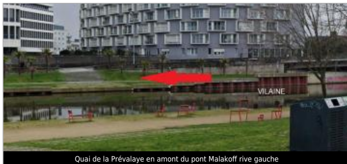
Quai de la Prévalaye en amont du pont Malakoff rive gauche

Coordonnées WGS84 : X: -1.69250731 / Y: 48.10731330