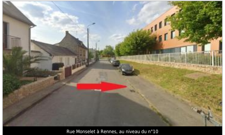
Rue Monselet à Rennes, au niveau du n°10

Coordonnées WGS84 : X: -1.70371053 / Y: 48.10444420