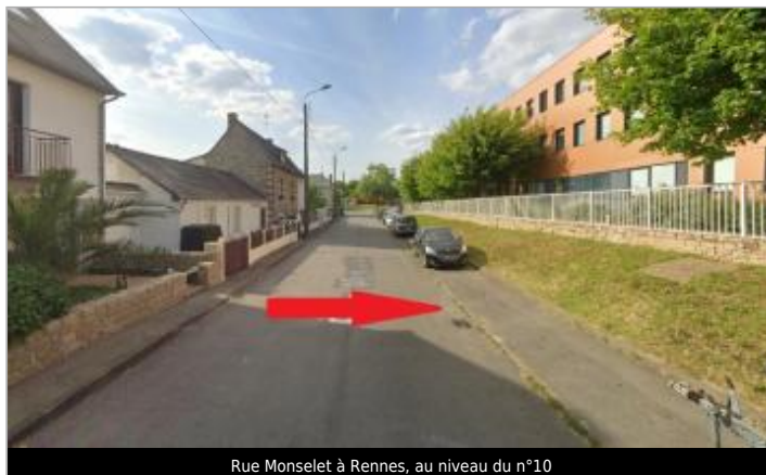
Rue Monselet à Rennes, au niveau du n°10