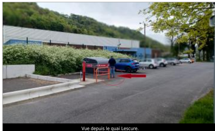
Vue depuis le quai Lescure.

Coordonnées WGS84 : X: 1.12020182 / Y: 49.41086930