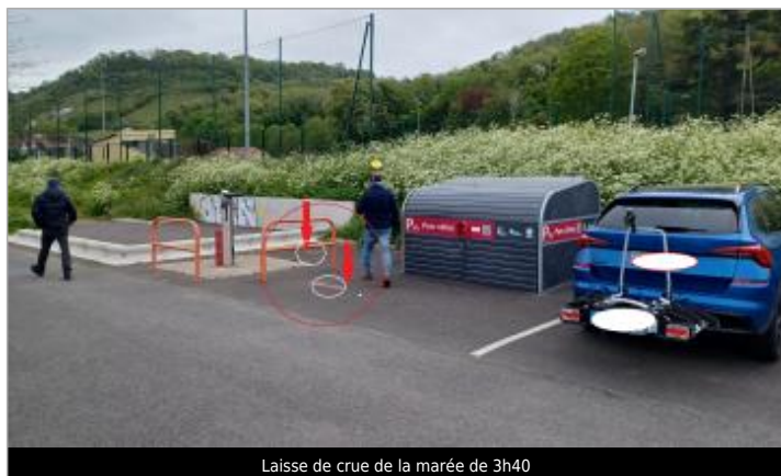
Laisse de crue de la marée de 3h40

Altitude calculée de l'eau (en m) : 5.34 m