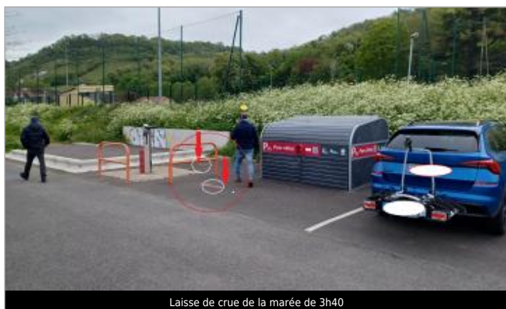
Laisse de crue de la marée de 3h40