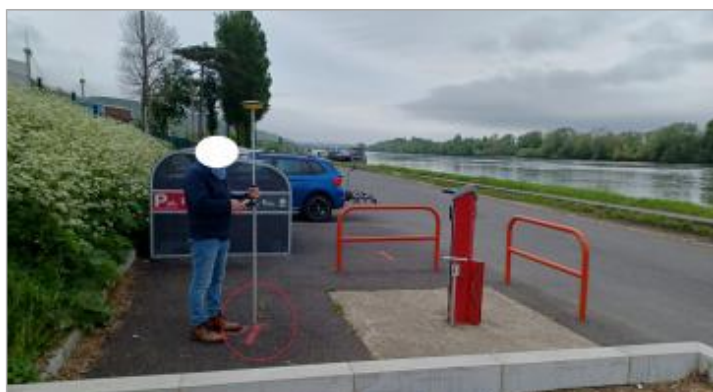
Laisse de crue de la marée de 16h00