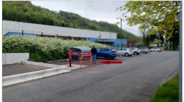
Vue depuis le quai Lescure.

Coordonnées WGS84 : X: 1.12020182 / Y: 49.41086930