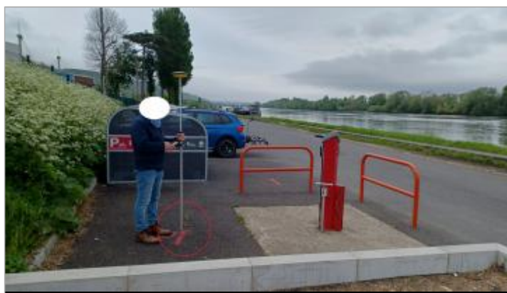
Laisse de crue de la marée de 16h00