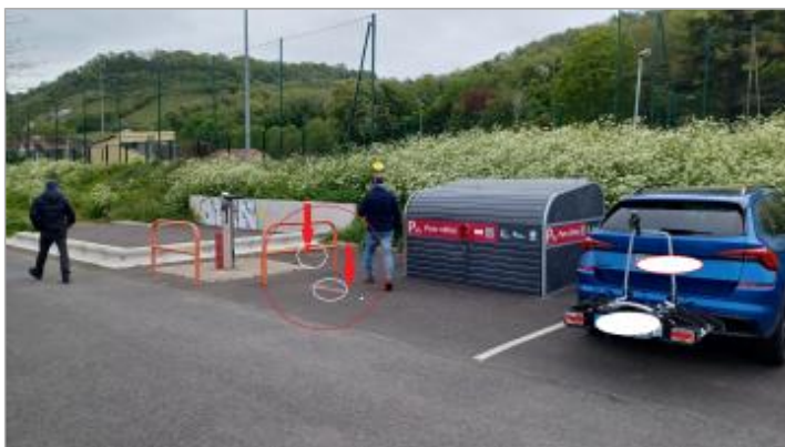
Laisse de crue de la marée de 3h40