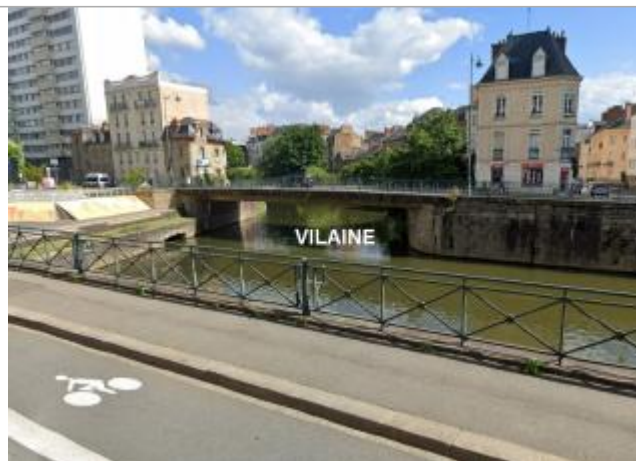
Pont Richemond vue de l'amont, du quai Dujardin