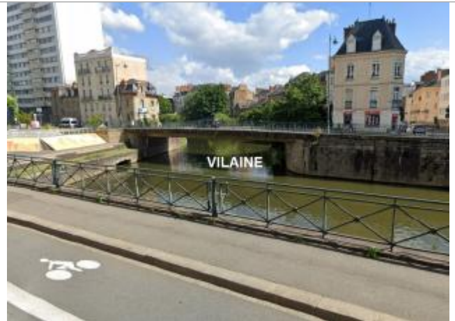
Pont Richemond vue de l'amont, du quai Dujardin

Coordonnées WGS84 : X: -1.67095770 / Y: 48.10983880