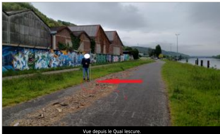
Vue depuis le Quai Lescure.