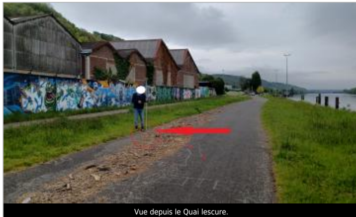
Vue depuis le Quai Lescure.