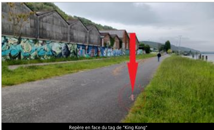
Repère en face du tag de "King Kong"

NIVELLEMENT DU SPC/SACN. LE SPC N'EST PAS GÉOMÈTRE EXPERT, LES COTES SONT DONNÉES À TITRE INDICATIF. - 30/04/2024