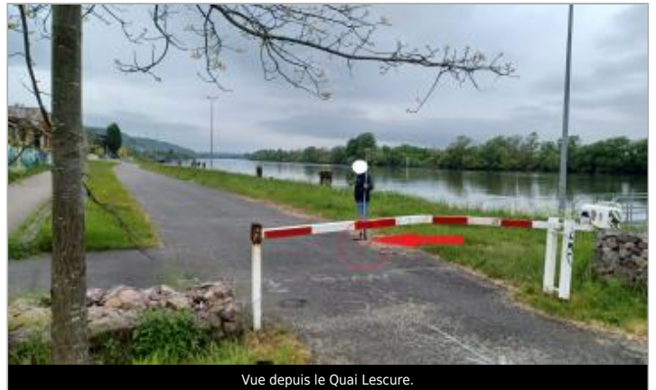
Vue depuis le Quai Lescure.

Coordonnées WGS84 : X: 1.11909169 / Y: 49.41313710