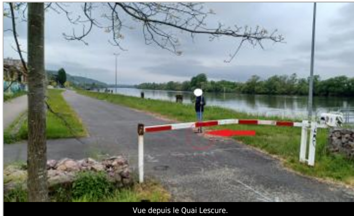
Vue depuis le Quai Lescure.

Coordonnées WGS84 : X: 1.11909169 / Y: 49.41313710