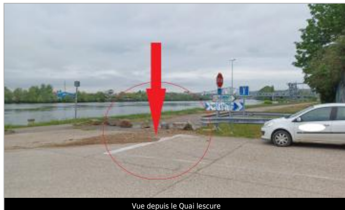
Vue depuis le Quai Lescure

Coordonnées WGS84 : X: 1.11367680 / Y: 49.42271040