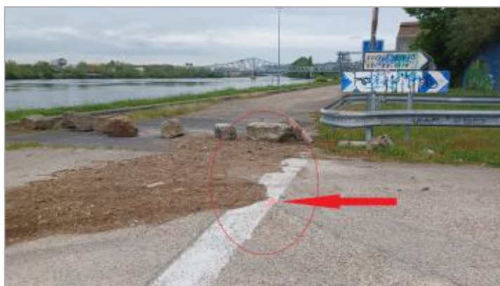
Laisse de crue au sol.