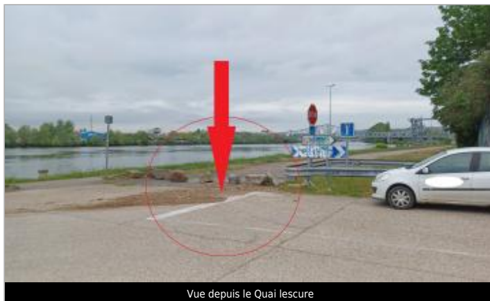
Vue depuis le Quai Lescure