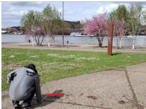
Repère à 11m vers les terres à la perpendiculaire du totem, à 34 cm du joint au sol

Texte : Repère à 11m vers les terres à la perpendiculaire du totem, à 34 cm du joint au sol