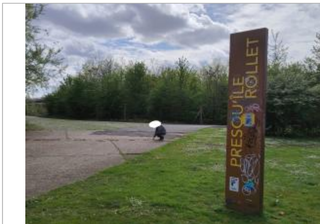
Totem "Presqu'île Rollet" à 100m en amont du pont Flaubert

Coordonnées WGS84 : X: 1.06641000 / Y: 49.44250000