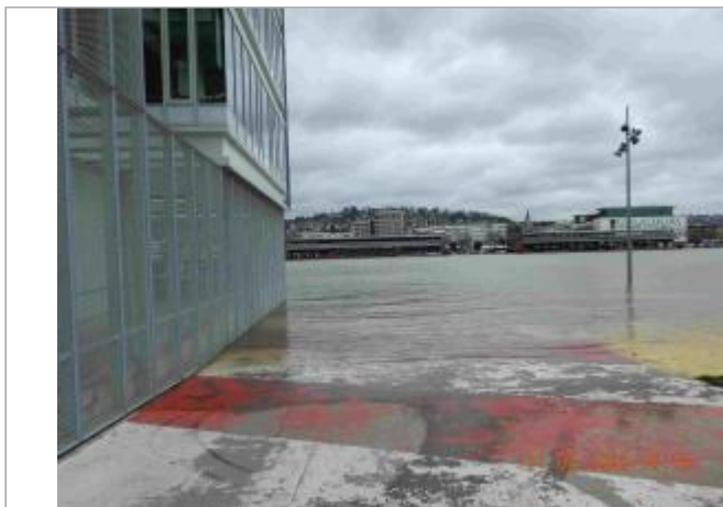
Quai de Seine à l'Est du bâtiment de la Métropole

Coordonnées WGS84 : X: 1.07139420 / Y: 49.44134200