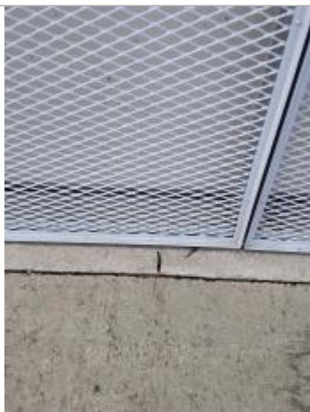
marqueur noir au niveau de la grille de la façade Est du bâtiment (il n'y a plus la peinture rouge et blanche au sol qui identifiait le repère de mars 2020)