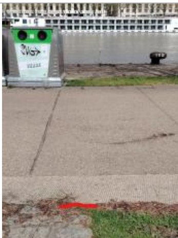
Laisse au sol à 16m de la bitte d'amarrage 109