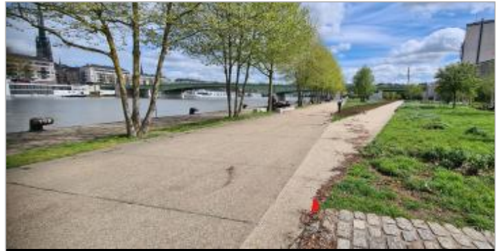
Site face bitte d'amarrage 109

Coordonnées WGS84 : X: 1.08896559 / Y: 49.43696250