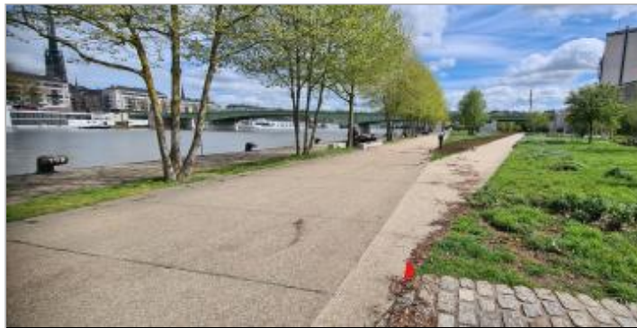
Site face bitte d'amarrage 109