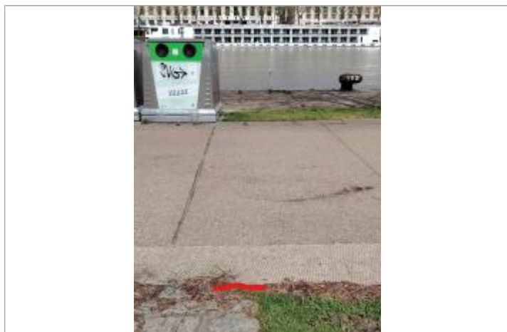
Laisse au sol à 16m de la bitte d'amarrage 109

Altitude calculée de l'eau (en m) : 5.35 m