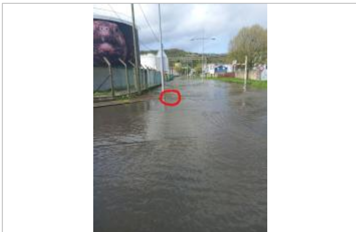
L'eau a atteint la limite de la bordure du trottoir

SOURCE DE REPÉRAGE : RELEVÉS DE LAISSES SUITE TEMPÊTE PIERRICK - 10/04/2024