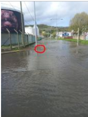
L'eau a atteint la limite de la bordure du trottoir

Altitude calculée de l'eau (en m) : 5.04