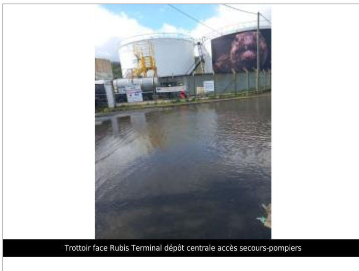
Trottoir face Rubis Terminal dépôt centrale accès secours-pompiers