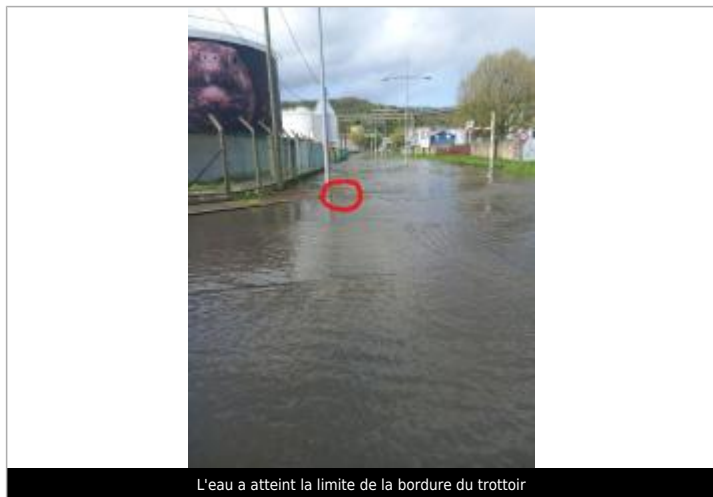
L'eau a atteint la limite de la bordure du trottoir

SOURCE DE REPÉRAGE : RELEVÉS DE LAISSES SUITE TEMPÊTE PIERRICK - 10/04/2024