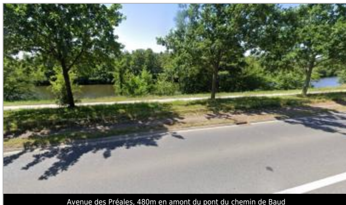
Avenue des Préales, 480m en amont du pont du chemin de Baud