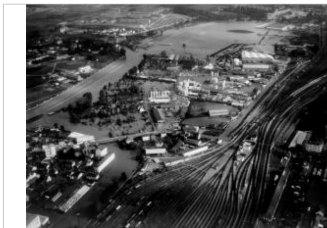
Quartier Baud-Charbonnet lors de l'inondation d'octobre 1966