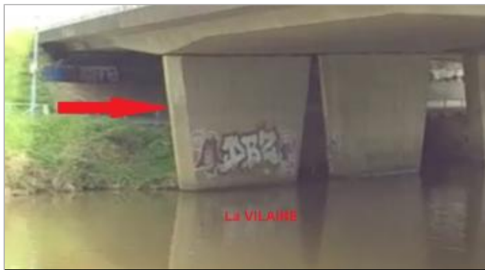
Quai Tabarly sous le pont de la rocade ouest