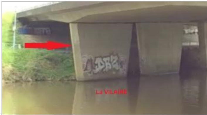
Quai Tabarly sous le pont de la rocade ouest