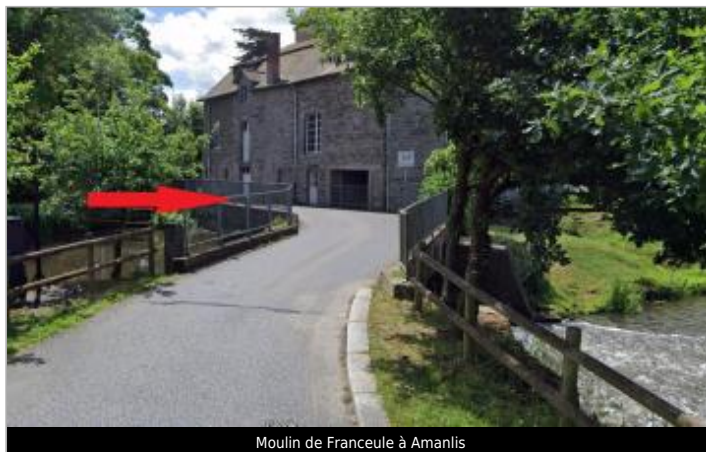
Moulin de Franceule à Amanlis