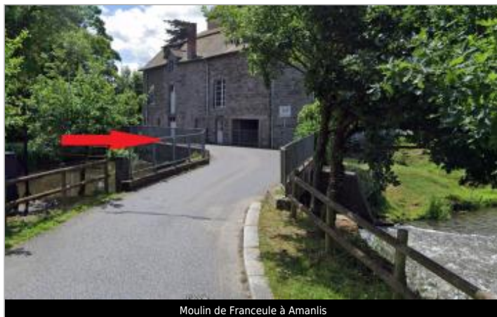
Moulin de Franceule à Amanlis