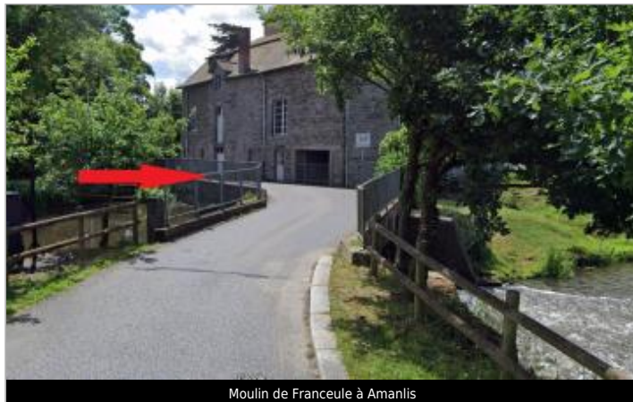
Moulin de Franceule à Amanlis

Coordonnées WGS84 : X: -1.45586122 / Y: 47.98673670