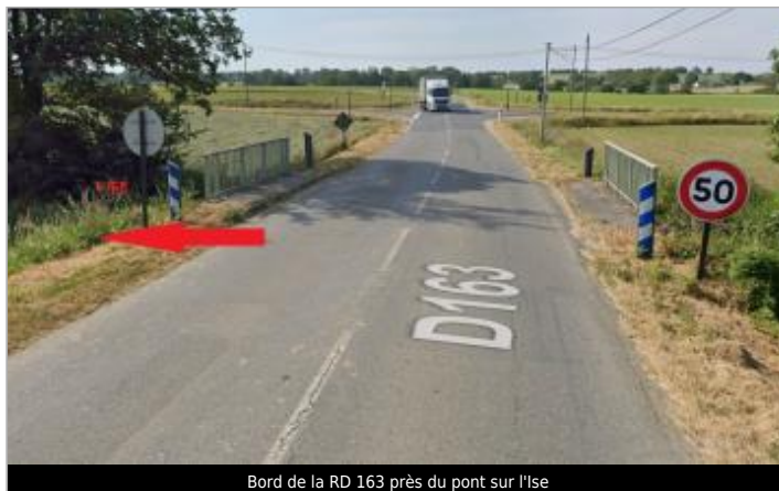
Bord de la RD 163 près du pont sur l'Ise