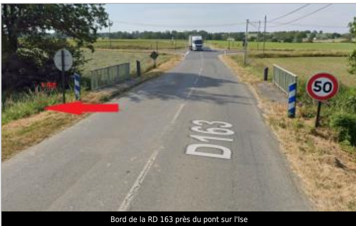
Bord de la RD 163 près du pont sur l'Ise

GÉOLOCALISATION Coordonnées WGS84 : X: -1.56714974 / Y: 47.94924080 Coordonnées RGF93 (Lambert 93) X: 359247.68 / Y: 6770840.53 Coordonnées RGF93 (ETRS89) : X: -1.5671497 / Y: 47.9492408 Code Hydro: J7474000 Rive de référence: Droite