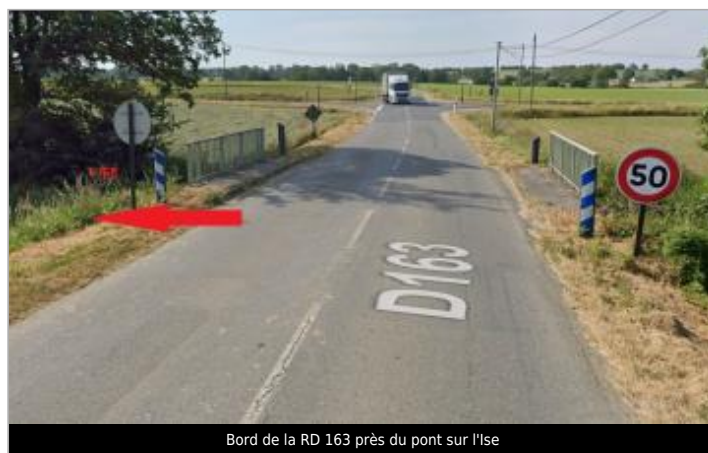
Bord de la RD 163 près du pont sur l'Ise

GÉOLOCALISATION Coordonnées WGS84 : X: -1.56714974 / Y: 47.94924080 Coordonnées RGF93 (Lambert 93) X: 359247.68 / Y: 6770840.53 Coordonnées RGF93 (ETRS89) : X: -1.5671497 / Y: 47.9492408 Code Hydro: J7474000 Rive de référence: Droite