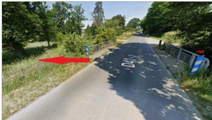
Champs au bord de la RD 41 à Corps-Nuds

Coordonnées WGS84 : X: -1.59092805 / Y: 47.97291000