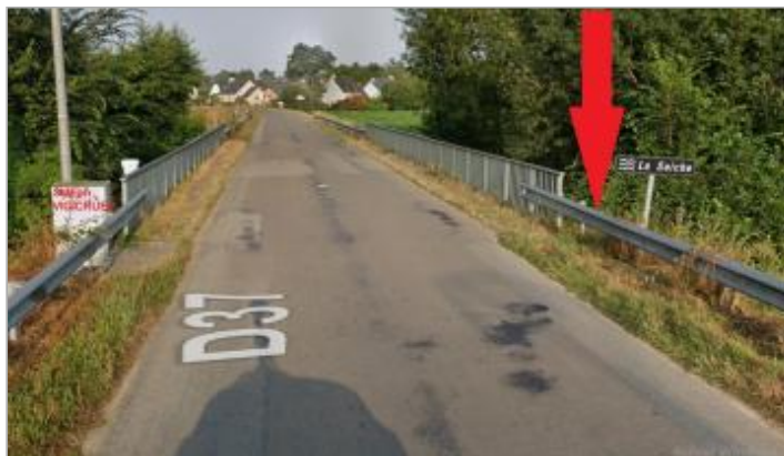
Pont de la RD 37 rive droite de l'autre coté du pont de la station Vigicruces