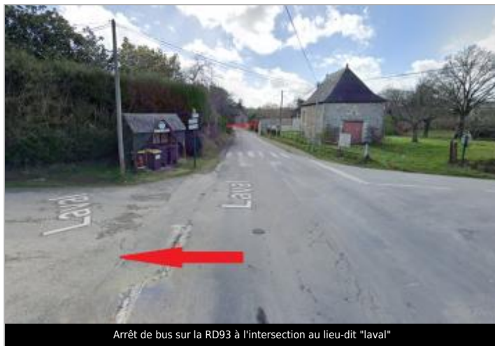
Arrêt de bus sur la RD93 à l'intersection au lieu-dit "laval"

Coordonnées WGS84 : X: -1.48247570 / Y: 48.02021700