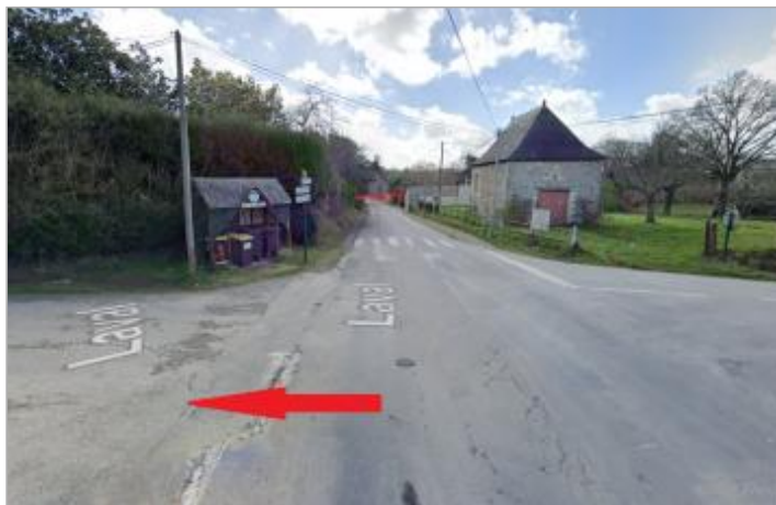
Arrêt de bus sur la RD93 à l'intersection au lieu-dit "laval"

Coordonnées WGS84 : X: -1.48247570 / Y: 48.02021700