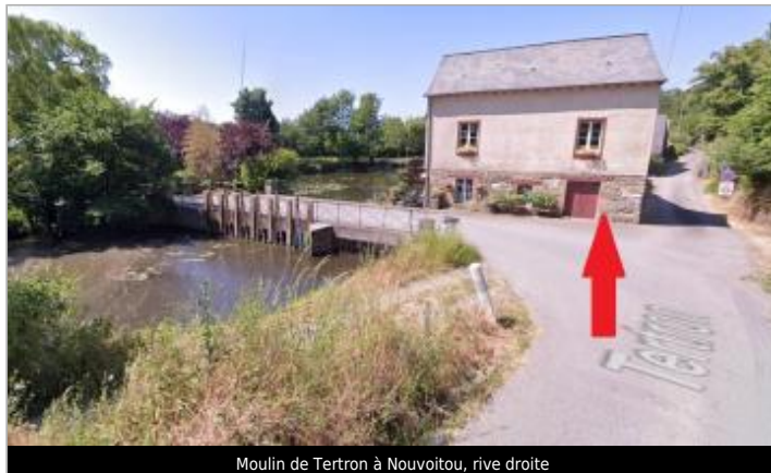
Moulin de Tertron à Nouvoitou, rive droite

Coordonnées WGS84 : X: -1.55321467 / Y: 48.02882000