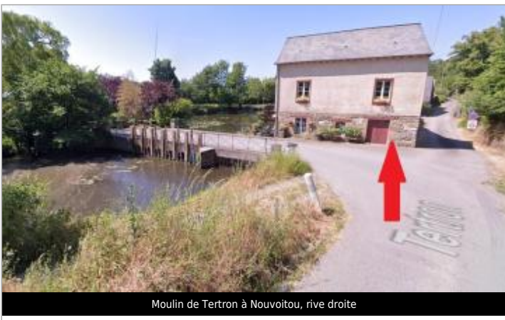
Moulin de Tertron à Nouvoitou, rive droite

GÉOLOCALISATION Coordonnées WGS84 : X: -1.55321467 / Y: 48.02882000 Coordonnées RGF93 (Lambert 93) X: 360795.84 / Y: 6779608.74 Coordonnées RGF93 (ETRS89) : X: -1.5532147 / Y: 48.02882 Code Hydro: J74-0300 Rive de référence: Droite