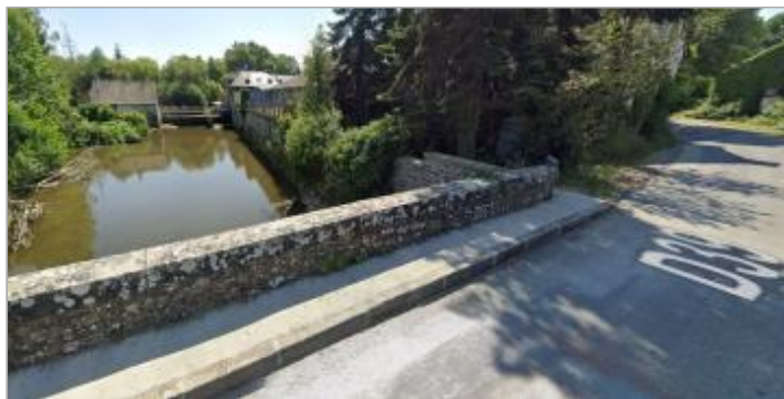
RD 39 au lieu-dit La Motte coté Saint-Armel, rive gauche

GÉOLOCALISATION Coordonnées WGS84 : X: -1.57737199 / Y: 48.01958430 Coordonnées RGF93 (Lambert 93) X: 358938.73 / Y: 6778688.21 Coordonnées RGF93 (ETRS89) : X: -1.577372 / Y: 48.0195843 Code Hydro: J74-0300 Rive de référence: Gauche