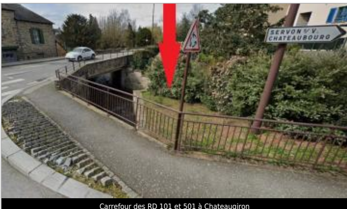
Carrefour des RD 101 et 501 à Chateaugiron

GÉOLOCALISATION Coordonnées WGS84 : X: -1.50352716 / Y: 48.04945100 Coordonnées RGF93 (Lambert 93) X: 364624.1 / Y: 6781685.35 Coordonnées RGF93 (ETRS89) : X: -1.5035272 / Y: 48.049451 Code Hydro: J7454000 Rive de référence: Droite