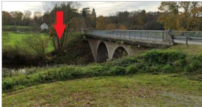
Pont de Saint-Jean, coté Saint-Didier, rive gauche

Coordonnées WGS84 : X: -1.36143160 / Y: 48.11358000