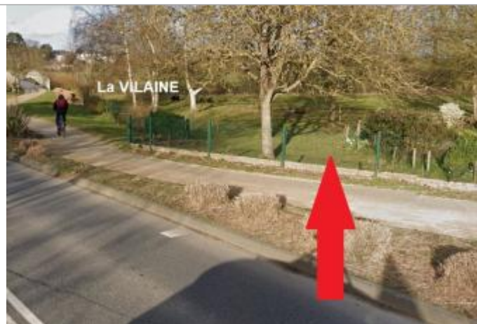
Entrée de Servon-sur-Vilaine, bord de la RD101