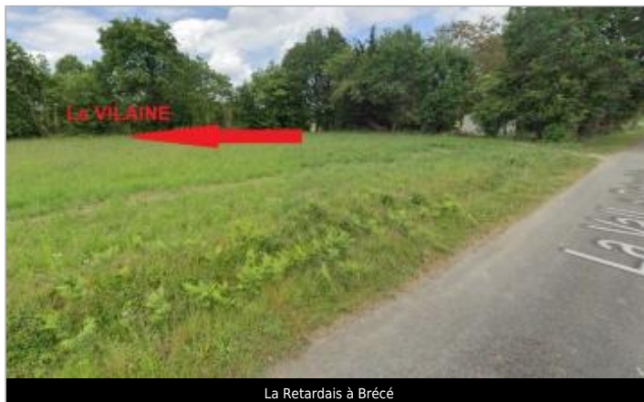
La Retardais à Brécé