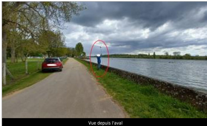
Vue depuis l'aval