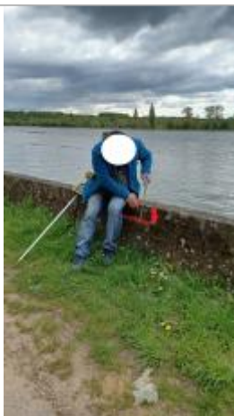
Laisse de crue à 17 cm/haut du muret.