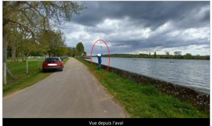
Vue depuis l'aval

Coordonnées WGS84 : X: 0.93548417 / Y: 49.46581500