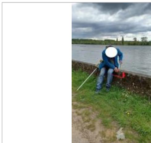
Laisse de crue à 17 cm/haut du muret.