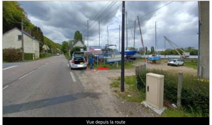
Vue depuis la route

Coordonnées WGS84 : X: 0.89829600 / Y: 49.48633660