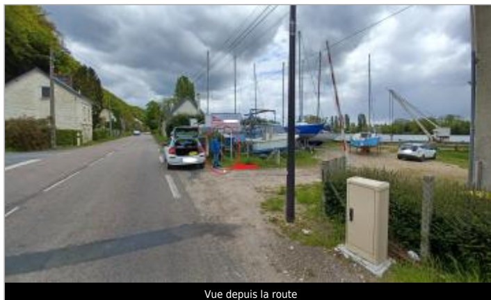
Vue depuis la route