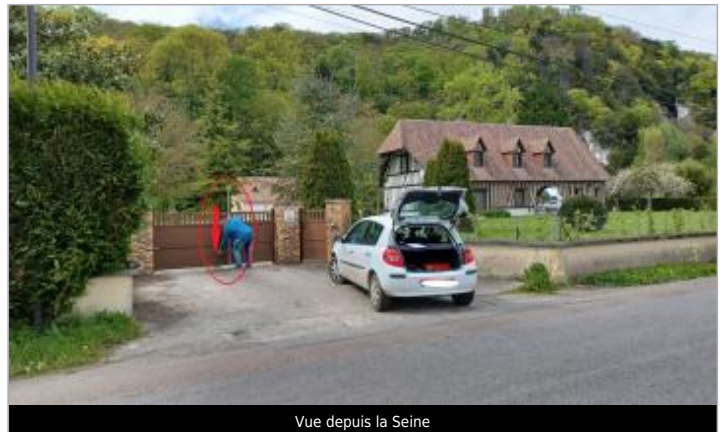
Vue depuis la Seine

Coordonnées WGS84 : X: 0.91752559 / Y: 49.36523860