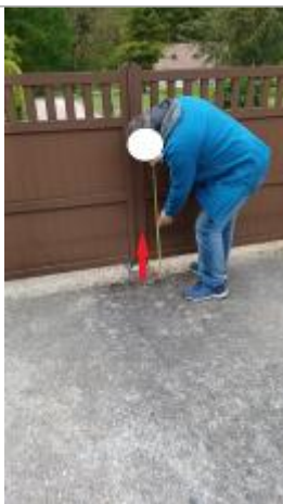
Laisse de crue à 35 cm/sol