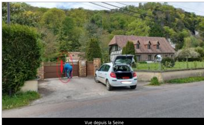
Vue depuis la Seine