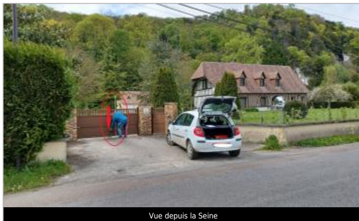
Vue depuis la Seine