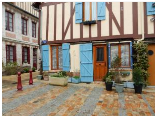
8 Place Saint Michel