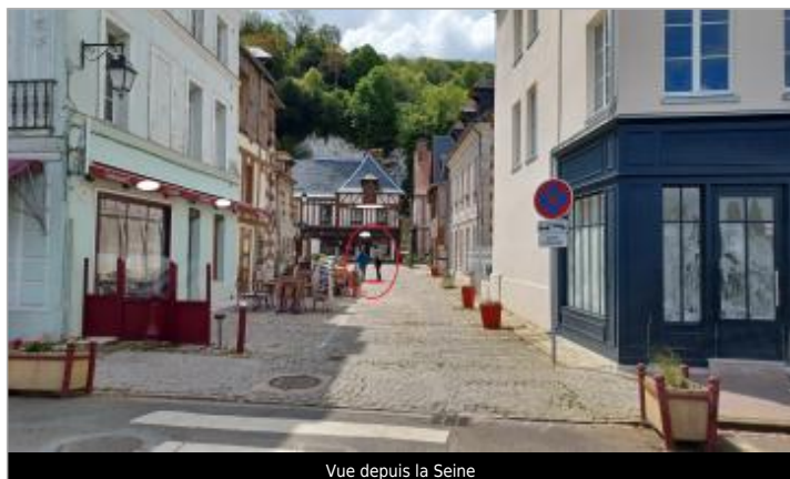
Vue depuis la Seine

SOURCE DE REPÉRAGE : VISITE DE TERRAIN SPC SACN - 11/03/2020