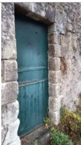
2025_Vue du repère

Système altimétrique : NGF IGN 1969 (système normal)