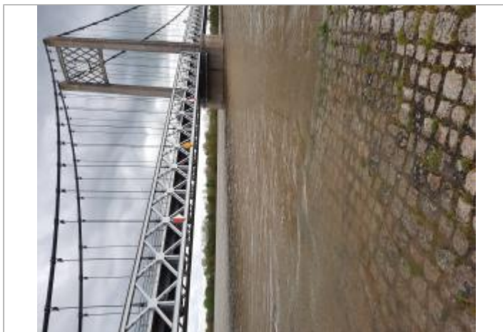
Vue sur le pont