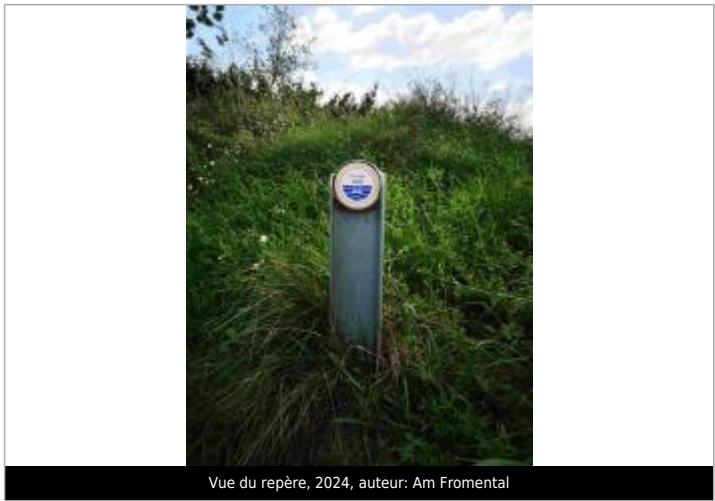
Vue du repère, 2024, auteur: Am Fromental