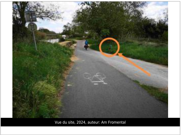
Vue du site, 2024, auteur: Am Fromental