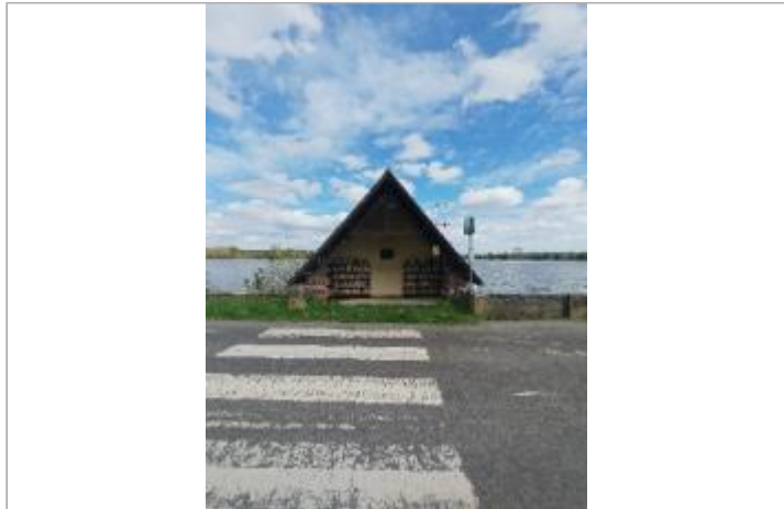
Bibliothèque libre service - abris