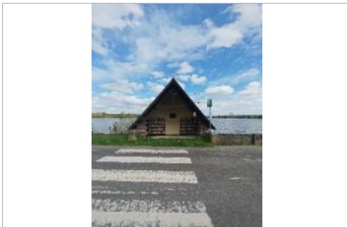
Bibliothèque libre service - abris

Coordonnées WGS84 : X: 0.91600000 / Y: 49.37176270